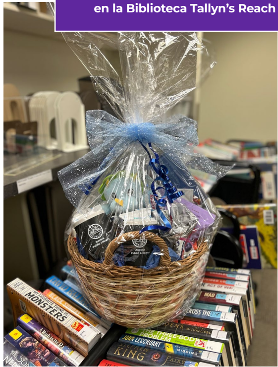
Premio del reto de lectura de invierno en la Biblioteca Tallyn's Reach