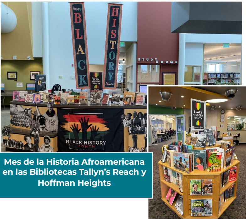
Mes de la Historia Afroamericana en las Bibliotecas Tallyn's Reach y Hoffman Heights