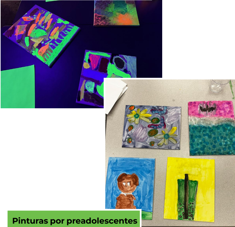
Pinturas por preadolescentes en la Biblioteca Central