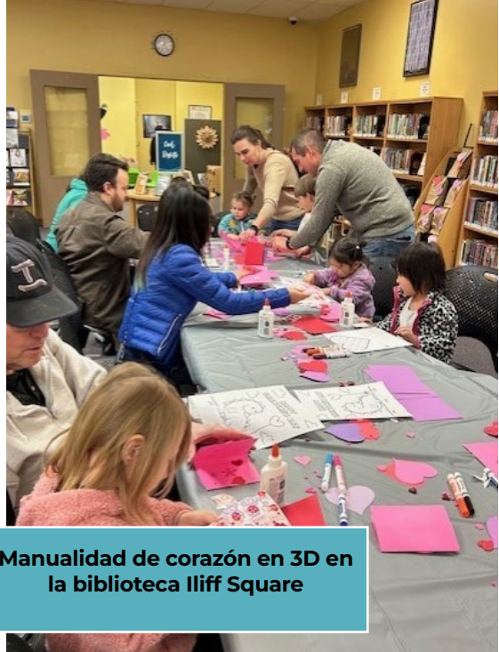
Manualidad de corazón en 3D en la biblioteca Iliff Square